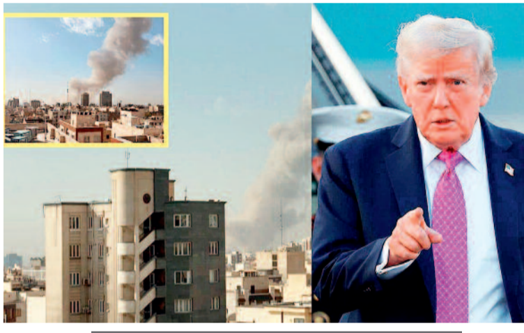
90 मिनट से अधिक समय तक ब्रीफिंग

एजेसी नई दिल्ली इस मामले से वाकिफ दो अधिकारियों ने जानकारी दी कि अमेरिकी रक्षा मंत्रालय पेंटागन के अधिकारियों की रविवार को हुई सीक्रेट मीटिंग के दौरान ट्रंप के अधिकारियों ने स्वीकार किया कि ऐसी कोई खुफिया जानकारी नहीं थी जिससे यह संकेत मिलता हो कि ईरान पहले अमेरिकी बलों पर हमला करने की योजना बना रहा था। रविवार को पेंटागन की इस मीटिंग में दिए गए बयान से ट्रंप का वो पुराना दावा खारिज हो जाता है। दरअसल ट्रंप सरकार के विरिष्ठ अधिकारियों ने पहले कहा था कि राष्ट्रपति ट्रंप ने ईरान पर हमला करने का फैसला आंशिक रूप से इसलिए लिया क्योंकि संकेत मिल रहे थे कि ईरान मध्यपूर्व में तैनात अमेरिकी बलों पर संभावित रूप से हमला कर सकता है।